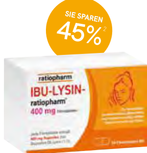
IBU-LYSIN-ratiopharm® 400mg Filmtabletten - 50 Stück