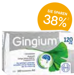
Gingium® 120 mg Filmtabletten - 120 Stück