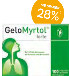
GeloMyrtol® forte Kapseln - 100 Stück