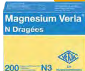
Magnesium Verla N Dragees – 200 Stück