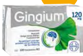
Gingium® 120 mg Filmtabletten – 120 Stück