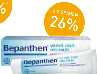
Bepanthen® Wund- und Heilsalbe Salbe – 100 g (129,80€/1 kg)