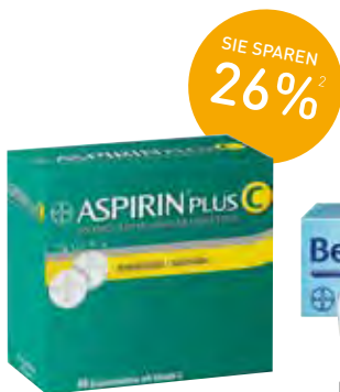
Aspirin plus C* Brausetabletten – 40 Stück