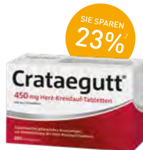
Crataegutt® 450 mg Herz-Kreislauf-Tabletten – 200 Stk.